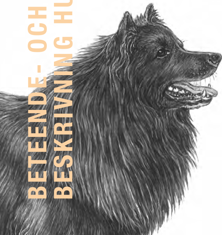
Svensk lapphund

Svenska Kennelklubbens mentalbeskrivning Beteende- och personlighetsbeskrivning hund, BPH, finns på flera håll i landet. Den är utformad för att passa alla hundar, oavsett ras.