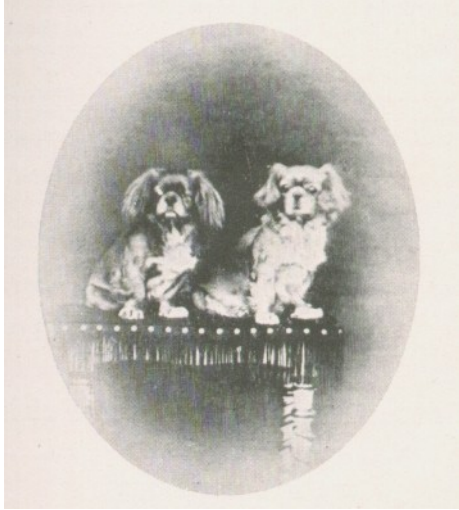
Guh och Meh.

att de var relativt små (ingen vägde mer än 2,2 kg) och nästan utan undantag blev de mycket gamla, till exempel hanhunden Schlorff levde 18 år i England. Under de närmaste decennierna skulle ytterligare ett antal individer av rasen importeras från öst. Till en början hamnade pekingsesen hos välsituerade och framlevde sitt liv på fashionabla adresser i London samt på gods och herrgårdar runt om i Storbritannien.