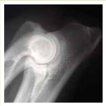
Frisk armbågsled, Grad 0

Armbågsleddysplasi (ED) är en onormal utveckling av armbågsleden som resulterar i en förslitning av ledbrusket vilken i sin tur ofta ger upphov till benpålagringar.