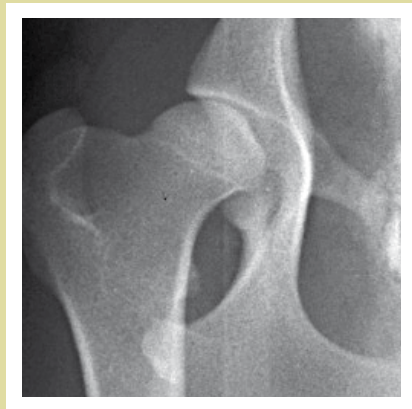
Höftled, med HD grad C

Det bör observeras att gamla hundar i enstaka fall kan få pålagringar och även smärtor från höftlederna trots att höftlederna varit utan anmärkning när hundarna var unga. Bakom ligger vanligen medicinska orsaker och då drabbas ofta även andra leder. Dessutom förekommer skador som man bara kan hänföra till ålder och förslitning.