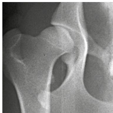
Höftled, med HD grad C