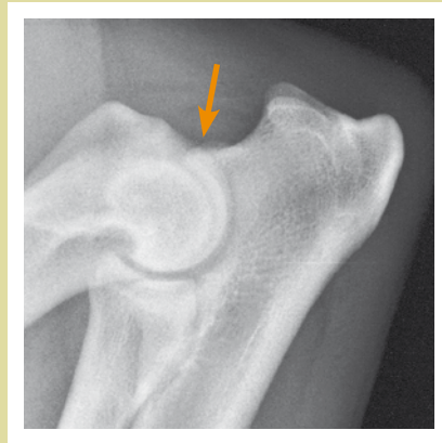
Armbågsled med ED grad I