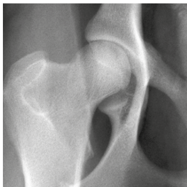
Frisk höftled, Grad A

Höftledsdysplasi (HD) är en felaktig utveckling av höftleden som förr eller senare ger upphov till förslitning av brosket i höftleden med benpålagringar som följd.