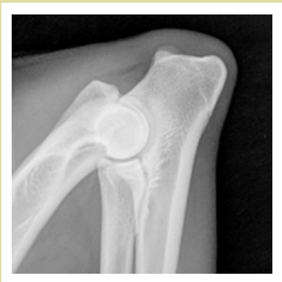
Normal armbågsled, Grad 0

Armbågsledds dysplasi (ED) är en onormal utveckling av armbågsleden vilken ofta ger upphov till benpålagringar (osteoartrit.)