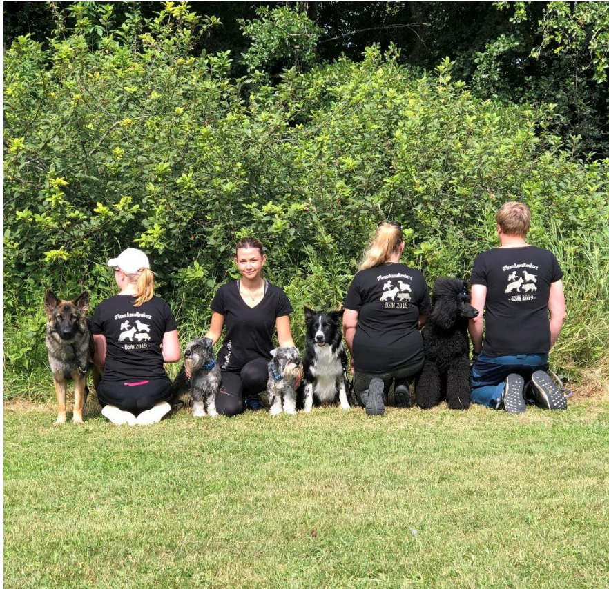
"Annas crew" på Ungdoms-SM 2019

För att sammanfatta så blev det en riktig fin hundhelg och ett minne för livet. Ett stort tack till mina fina vänner som lånade ut sina fantastiska hundar, var på plats och ställde upp med både sällskap, pepp och många skratt. Jag är så tacksam för förtroendet att få visa era hundar och det har verkligen utvecklat mig som hundförare att få träna och tävla med så olika hundar på olika nivåer! Såklart vill jag även rikta ett stort tack till Agria cupen för att ni gör en sån här satsning för ungdomar!!