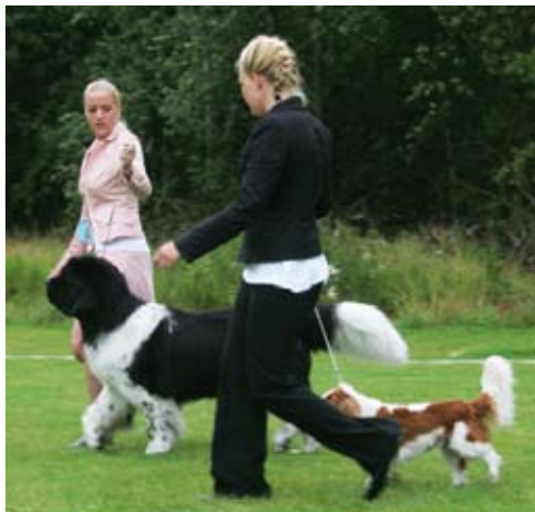
Vid parvisning får handlern med den större hunden anpassa sitt tempo till den mindre hunden.

På hundutställningar, där det är hunden och inte handlern som ska bedömas, får man oftast visa hunden i en triangel och fram och tillbaka.