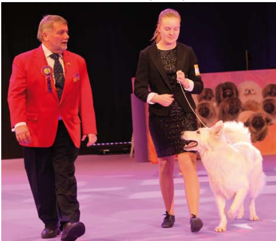
En handlers uppgift är att - förutom att visa hunden så bra som möjligt - även vara uppmärksam på domaren. Det kan vara lättare sagt än gjort när man är spänd och nervös. Här är det en SM final i junior handling som ska avgöras inför fullsatta läktare och handlern verkar klara uppgiften mycket bra.