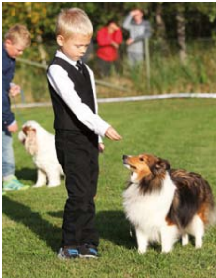
Det ska börjas i tid! Sveriges Hundungdom anordnar tävlingar för så kallade minior handlers, en klass för barn som är mellan 6 och till och med 9 år. Den här unge pojken tävlade på Ungdoms SM med sin shetland sheepdog.

Domaren ska bedöma varje hund i jämförelse med den rasstandard som finns nedskrivna för alla rashundar som får delta på officiella utställningar. Domaren tittar på hur hunden ser ut när den står och hur den rör sig från olika vinklar. Domaren fingranskar också hunden, känner igenom hundkroppen med sina händer och tittar närmare på hundens tänder och bitt. Handlerns uppgift är att följa domarens instruktioner om var hunden ska stå, hur den ska springa (i vilken figur) och även hjälpa till när domaren ska titta närmare på hunden. På en junior handlingstävling är det i första hand samarbetet mellan handler och hund som domaren tittar på. Vidare bedöms handlerns uppmärksamhet mot domaren och andra funktionärer. Men mycket viktigt är också hur en tävlande uppträder mot sin hund och även sina medtävlare; att visa god sportsmannaanda och vara trevlig och artig.