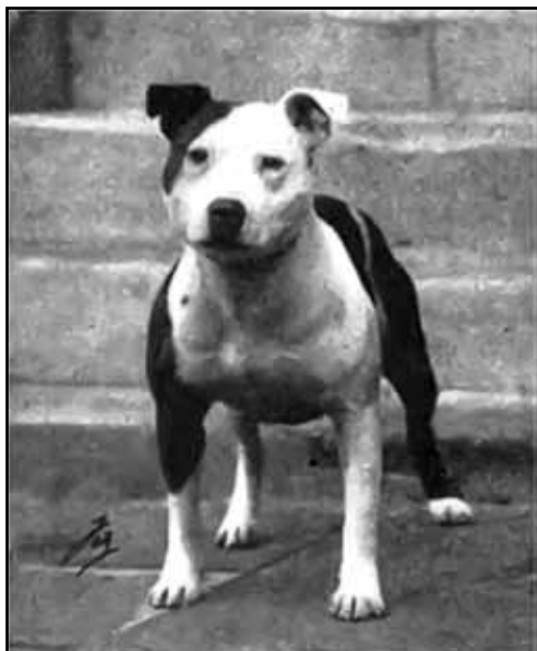
Ch. Gentleman Jim och Ch. Lady Eve, De två första Champions av rasen Staffordshire Bullterrier