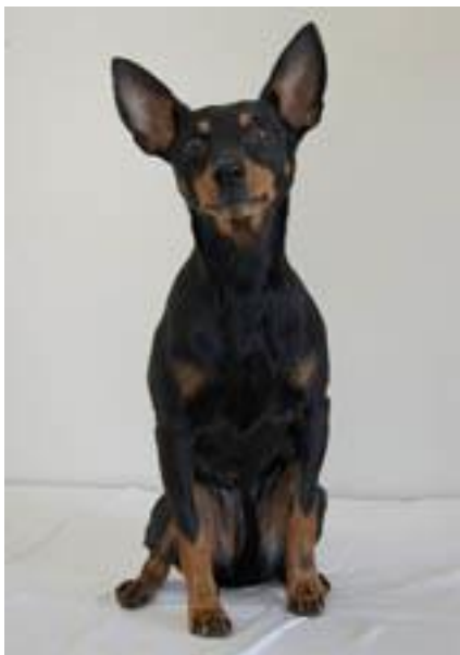
Bra päls på bröst