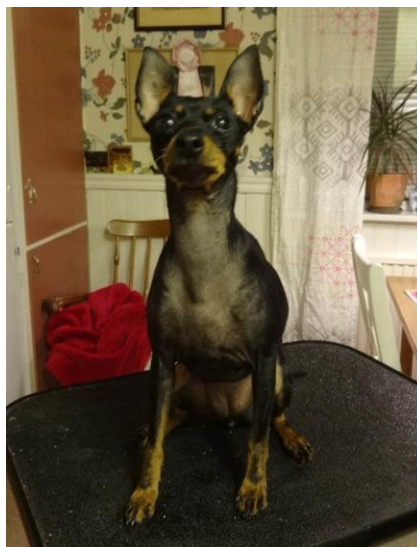
Sämre päls på bröst