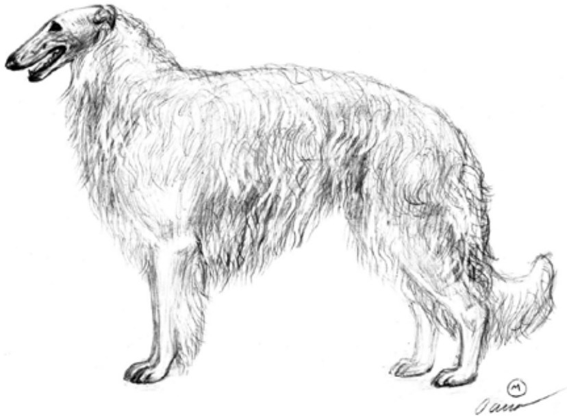
Illustration Marina Ostrovskaya

(Rasnamn i hemlandet: Russkaja psovaja borzaja)