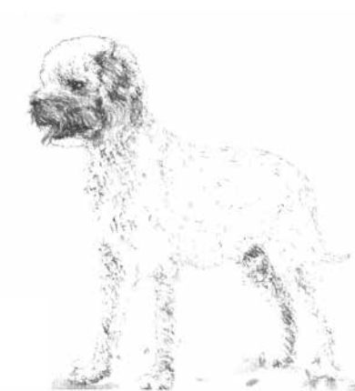
Illustration: Giovanni Morsiani