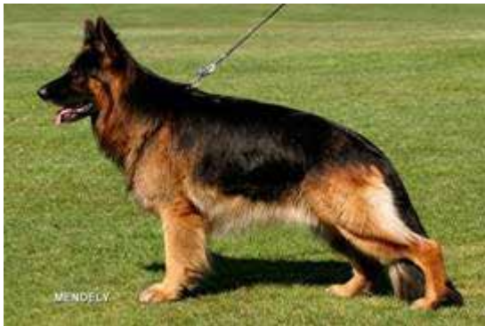
Lång dubbelpäls (Langstockhaar)