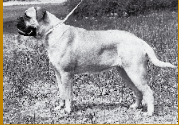
SUCh Duralex Fawn Faithful Lass, kennelns stamtik, mor till Kamek's Astrea som såldes till Norge.

Väldiga, men sävligt godmodiga och vänligt nyfikna, tar "bullarna" emot med viftande svansar. Alla förutfattade meningar om hundar av molosstyp kommer på skam. Valet av oömma kläder var nog i och för sig riktigt, men inget hängande dregel så långt ögat når och de enorma kropparna är överraskande spänstiga.