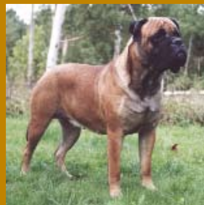
F.v. Kamek's Lilla Vackra Anna "Nellie", mamma till bland andra SUCH Kamek's King Richard. Nummer fem var Kamek's Margaritha "Frida", mamma till bland andra SUCH Kamek's The Gun. SUCH Kamek's Jeanne d'Arc "Siri Silkeshöna", sexa i successionsordningen.