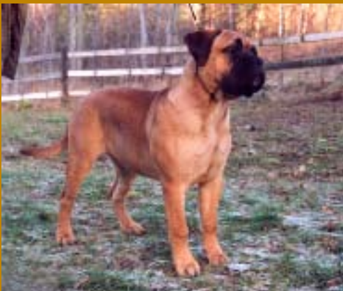
Kamek's Cinnamon, som flyttade till Island och tillbaka igen med ett tre cert i bagaget.