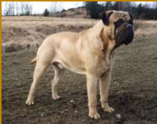
SUCh Kamek's King Lear, son till SUCh Kamek's Solitaire, far till fem kullar. "Nelson" har även figurerat i "Bolibompa"!