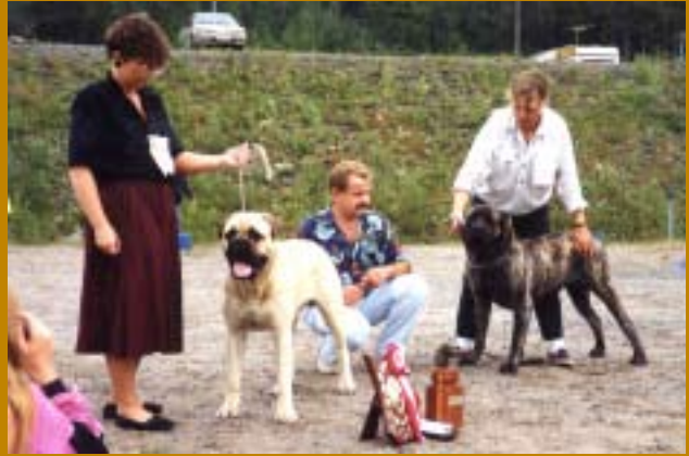
SUCh Kamek's Black Knight (t.v.), son till SUCh Britannia of Bunsoro, blir BIS på en rasspecial endast 13 månader gammal.