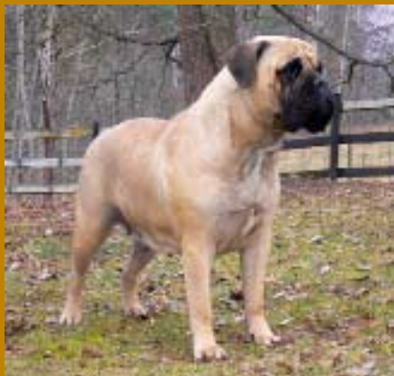
SUCh Kamek's Morwenna, senast i raden avelstikar och mor till "Joline".