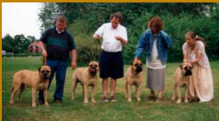
Fyra generationer: SUCh Kamek's Kaiser, SUCh Kamek's Black Friar (u. SUCh Britannia of Bunsoro), SUCh Maxinice Bomme Boll (u. S N UCh Lötgårdens Natascha) och Doggmas Irish Mr. Ira (u. Doggmas Xcellent Lady X).