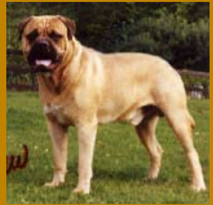
Tre bröder efter Todomas Benedict of Oldwell undan SUCh Bogeruddåsens Flora: SUCh Kamek's Kaiser, SUCh Kamek's Kejsar Nero och SUCh Kamek's King Arthur.

från England på 80- och 90-talen, SUCh Britannia of Bunsoro och SUCh Bunsoro Bangle. De fick ett par kullar var, men Vakkalas valde av olika orsaker att inte fortsätta på deras tiklinjer, även om några av hanarna har använts på olika håll och en tik gick i avel på kennel Tombrims.