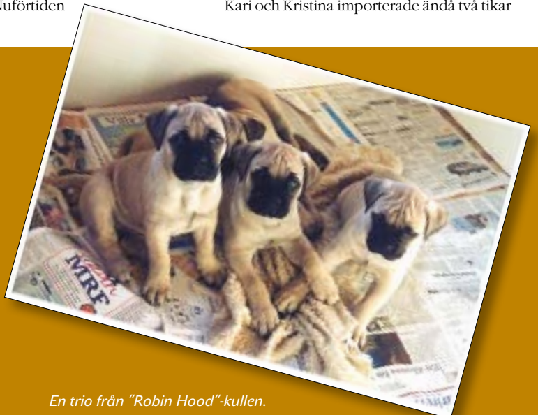
En trio från "Robin Hood"-kullen.