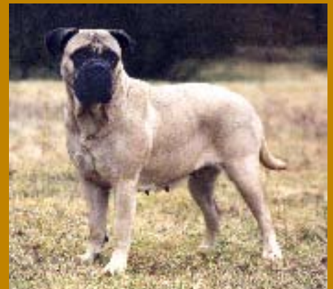
Fr.v. SUCh Bogerudåsens Flora "Frida", dotter till Kamek's Astrea och mamma till bl.a. SUCh Kamek's Kaiser. Den tredje i kennel Kamek's tiklinje - SUCh Kamek's Solitaire "Sally". Nummer fyra var Sallys dotter Kamek's Julia "Julia".