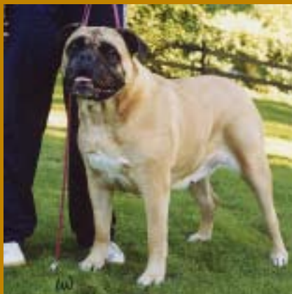
SUCh Bunsoro Bangle, mor till LVUCh Kamek's Swedish Legend, exporterad till Lettland.