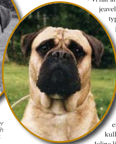
Släktycke! SUCh Kamek's Kaiser och en av hans söner med SUCh Bunsoro Bangle; Kamek's Ymer.