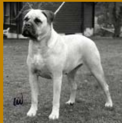
SUCh Britannia of Bunsoro importerades 1986 och fick två kullar.