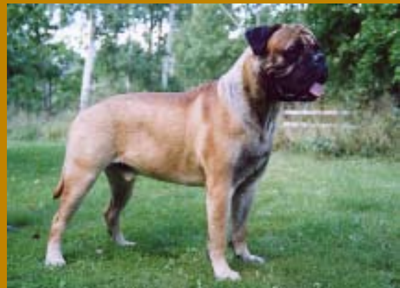
SUCh Kamek's Braveheart, son till Kamek's Margaritha, far till en kull.