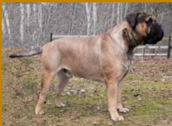
SUCh Kamek's Attraction, son till SUCh Kamek's Jeanne d'Arc.