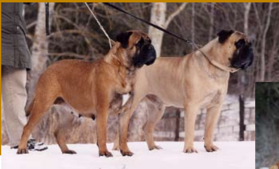
Kamek's Margaritha och S N UCh Sv-01 -02 -03 Nordv-02 -03 Kamek's King Richard.