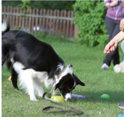
Som de flesta vallhundar går det fort fort, och här gäller det att vara med som förare...