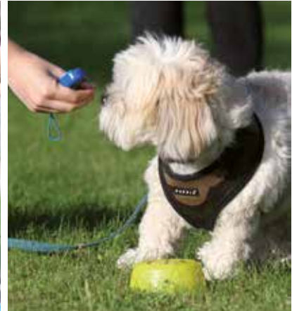
Två bra hjälpmedel vid träningen: en klicker och gott godis!